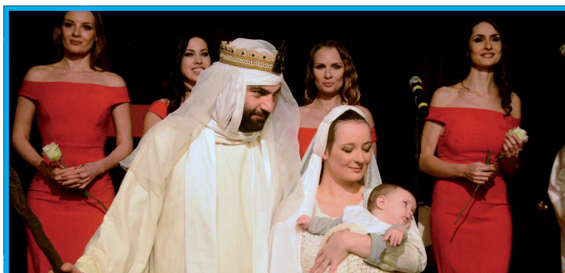
Rappresentazione del Natale in Duomo ad Alba nel 2018.

Non abbiamo mai fatto mancare il sangue, né quest'anno né mai in questi anni dalla fondazione nel 1949. Ci stiamo organizzando per ringiovanire la sezione con incontri nelle scuole superiori di quarta e quinta con una rispondenza molto