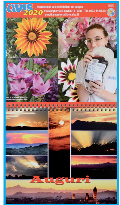
Ecco il calendario avvisino 2020. Speriamo giunga gradito a tutti.

Il calendario è distribuito in forma gratuita a tutti gli avvisini. Parte del costo è stata offerta dal Centro Servizi per il volontariato, parte è stato coperto dalla nostra sede. Impaginazione e grafica della Gazzetta d'Alba, foto di Severino Marcato, stampa Pralorme grafica di Montà.