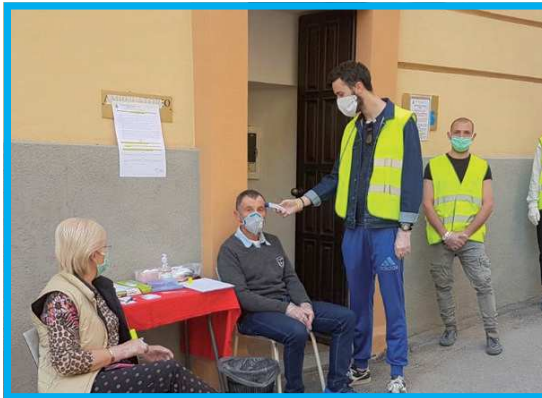
A Vezza prima del prelievo sono state introdotte misure di controllo per il Covid-19.

Mascherina, guanti, misurazione della temperatura corporea, liquido disinfettante ma soprattutto